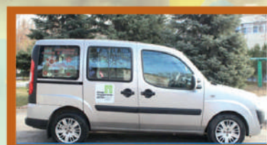
Социальное такси 48-31-77